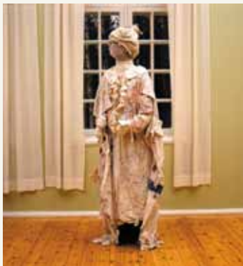
Klänning tillverkad av en patient.

Arr: Sätters Hembygdsförening, Mentalvårdsmuseet och Landstinget Dalarna